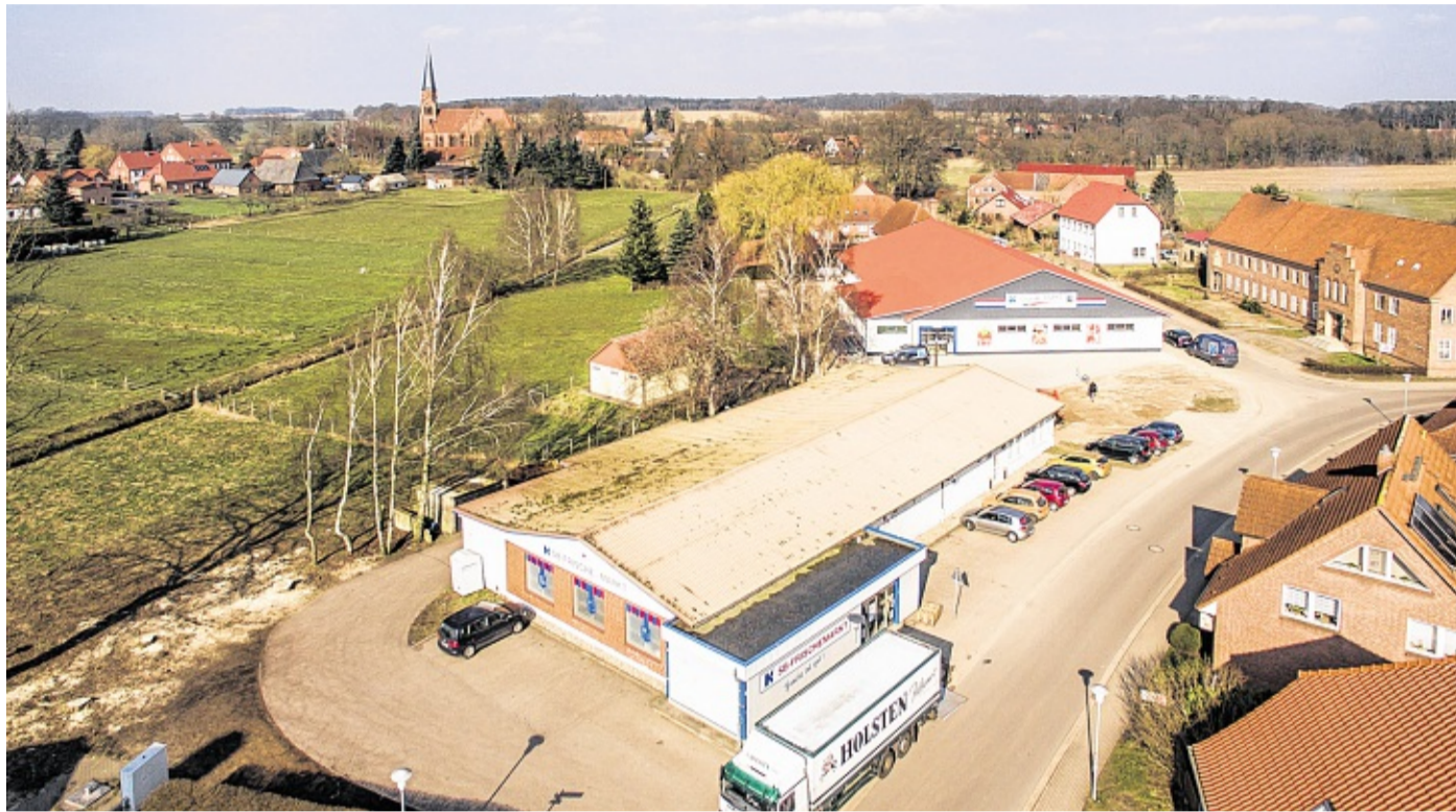
Viele Vellahner werden sich bestimmt noch an diesen Anblick erinnern. Dort, wo der alte Konsum stand, ist jetzt Parkplatz.

VELLAHN Der Anblick des Zentrums von Vellahn hat sich verändert. Mit dem Neubau des Konsums, dem Flächentausch und dem Neubau des großzügigen Parkplatzes durch die Gemeinde ist ein völlig neues Zentrum des Ortes entstanden. Die beiden nebenstehenden Fotos zeigen die Entwicklung. Das große Foto, das Tilo Röpcke mit seiner Drohne aufgenommen hat, zeigt die Situation vor dem Abriss des alten Konsum-Gebäudes. Auf dem Foto darunter ist der gegenwärtige