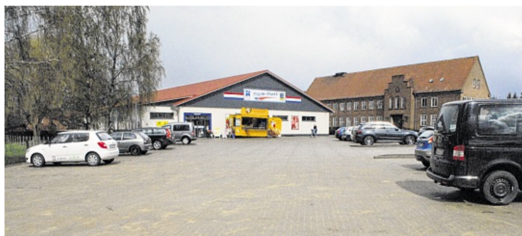
Der Parkplatz vor dem Konsum in Vellahn ist gerade erst fertig geworden.